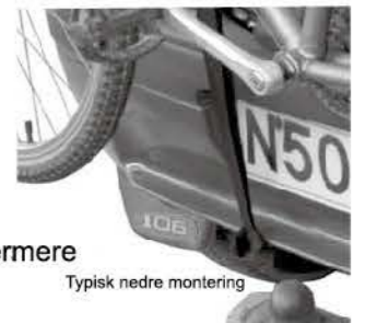
Typisk nedre montering