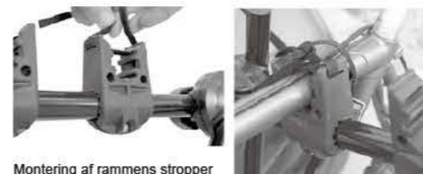
Montering af rammens stropper