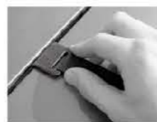
Rengør køretøjet før krogene placeres