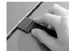
Typisk øvre montering