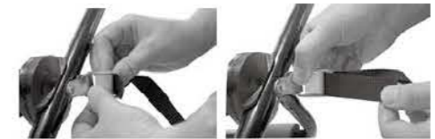
Montering af øvre remme gennem fjederlåsespænderne