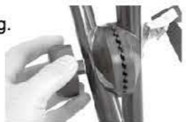
Sådan løsnes låsemekanismen