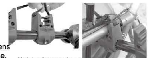
Montering af rammens stropper

Foreslag til hvordan styr og hjul spændes fast for større sikkerhed (Bemærk: Du kan få brug for yderligere bagageremme til dette – kan købes i din lokale Harald Nyborg-forretning).