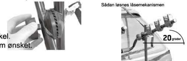
Sådan løsnes låsemekanismen